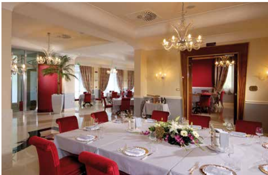
Una delle sale del ristorante Rossi Sapori

nice a quattro stelle dello Zanhotel & Meeting Centergross, trova l'ideale collocazione anche il ristorante "Rossi Sapori", elegante e con un servizio di alto livello, uno dei migliori ristoranti di Bologna, che propone i tipici piatti della cucina italiana, arricchiti da un personale tocco di fantasia dello chef. I primi piatti, preparati nel pieno rispetto della tradizione, utilizzano ingredienti di prima qualità e si accompagnano al meglio ad una ricchissima lista dei vini ed una cantina sempre alla ricerca di nuovi e pregiati sapori, per un percorso enogastronomico "a tutto gusto".