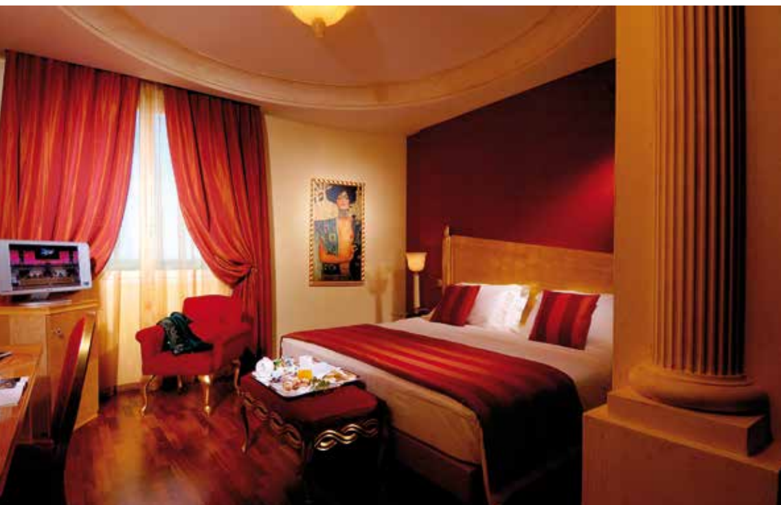
Una camera dello Zanhotel & Meeting Centergross