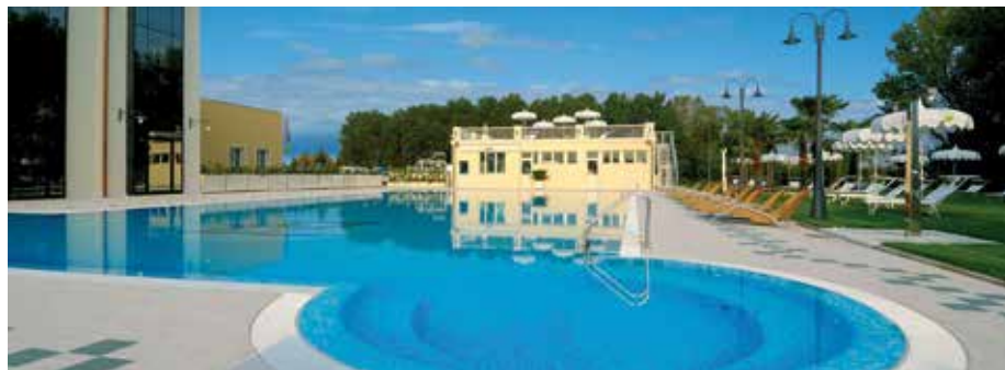
Lo Zanhotel & Meeting Centergross che racchiude al suo interno centro congressi, SPA e Ristorante

Oltre alle 152 camere e all'ampio centro