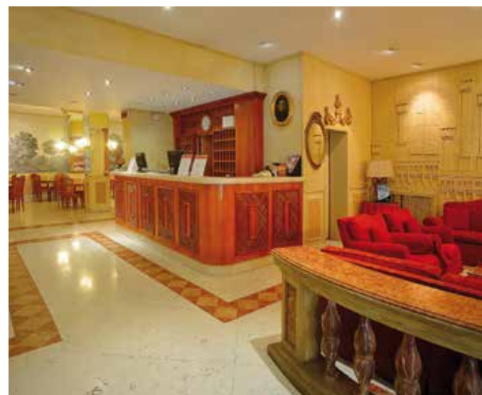
La hall dello Zanhotel Regina, anch'esso nel centro storico del capoluogo emiliano