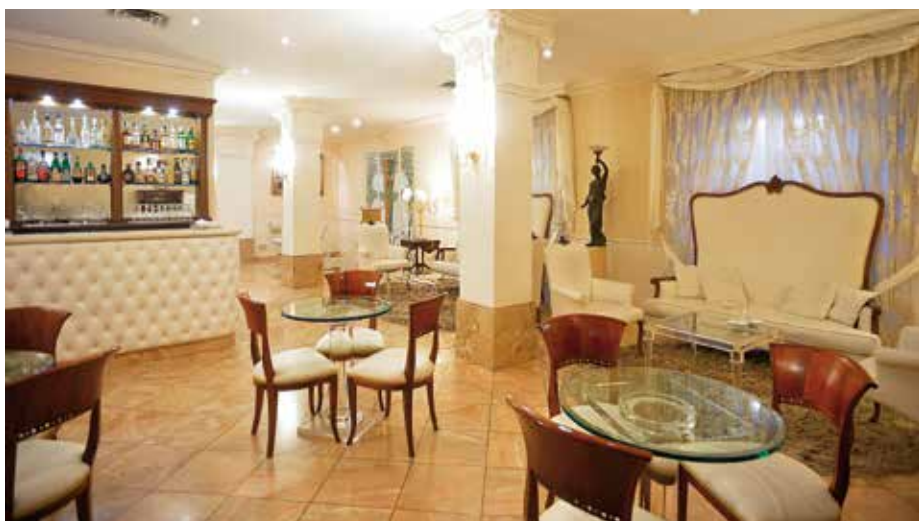
L'area bar dello Zanhotel Tre Vecchi, 4 stelle situato a due passi da Piazza Maggiore

più efficienti e di elevata qualità, in grado di creare una dimensione dinamica ed allo stesso tempo familiare per i nostri ospiti, così da farli sentire 'a casa' anche quando ne sono lontani".