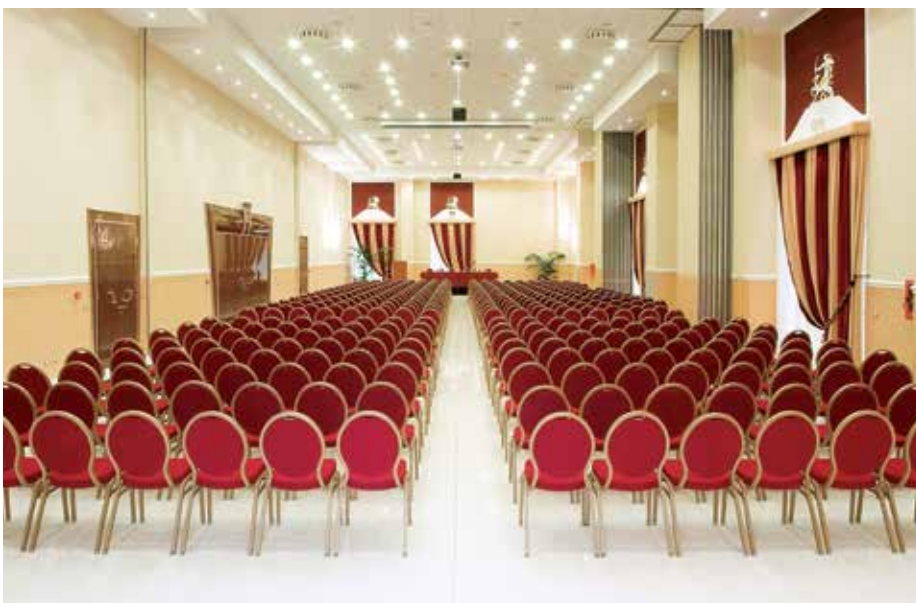
Una delle sale dello Zanhotel & Meeting Centergross, dotato del centro congressi in hotel più ampio e versatile dell'Emilia Romagna